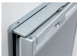
▲ N. 6 - Chiusura brevettata: posizione di "vent"