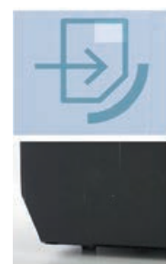
▲ CRX 50/65 con smusso