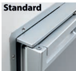
▲ 50.903.xx - Telaio da incasso standard