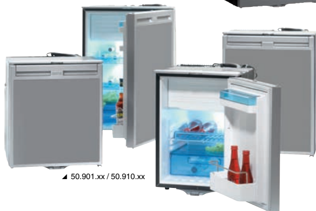
▲ 50.901.xx / 50.910.xx