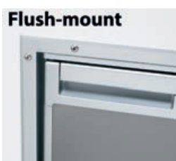
▲ 50.904.xx - Telaio Flush-mount