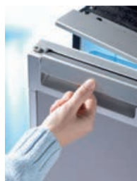
▲ N. 4 - Maniglia integrata nella porta

Regolazione temperatura precisa con sensore NTC (serie CRX: regolazione tramite pannello Touch-Control. In base alla regolazione il frigo è configurabile come frigo, frigo/freezer, freezer fino a -8°).