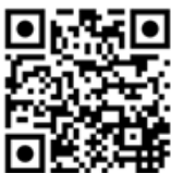
Guarda il video