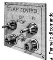
Pannello di comando