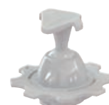
▲ Supporto battagliola